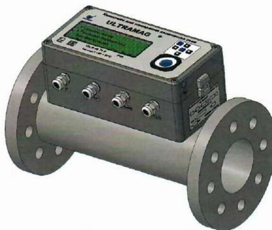
Рисунок 1 - Общий вид комплекса «ULTRAMAG»

Комплексы имеют 3 варианта исполнения по погрешности измерения рабочего расхода и следующие модификации в зависимости от верхней границы диапазона измерения рабочего расхода: G10, G16, G25, G40, G65, G100, G 160, G250.