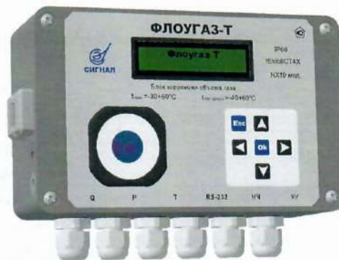
Рисунок 1 - Общий вид блока коррекции объема газа «Флоугаз-Т»

Для передачи информации о стандартном (или рабочем) объеме газа предусмотрен НЧ-выход.